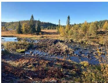
Klopp ved Bukono

Vi har også et løypemannskap som har brukt utrolig mange timer og gjort en fantastisk jobb for å bedre og gjøre løypene mer tilgjengelig for alle. Mange hytteveier har stilt opp med stort mannskap på dugnad for å bedre løypetraseer og rydde trær og kratt. Det er lagt klopp over Vangsjøåni ved Bukono (slipper gå på Stølsvegen over brua) og justeringer av løypene ved Rennsendbekken, Gamasama og Bukono. Vi har lagt ny løypetrase for løypa rundt Synhaugen, og i vinter vil vi kjøre veitraseen om Synhaugen. Vi har satt ut over 500 staur og vi har fått laget nye informasjonstavler/kart som skal settes ut i løypekryss. Tusen takk til alle som bidrar for Mellad'n på denne måten!